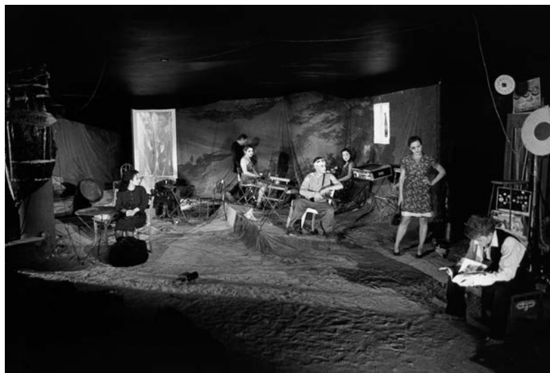
Atelier Matthias Langhoff - Viande de Perroquet - Mars/avril 99